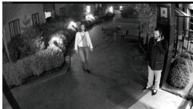
Les images ci-dessus illustrent la fonction jour/nuit de la caméra AXIS M3025-VE : le mode jour est présenté à gauche, le mode nuit à droite.