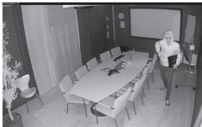
Les images ci-dessus de la caméra AXIS M3024-LVE présentent le même scénario : un homme avec une lampe de poche dans une pièce sombre. Sur ces images, nous pouvons constater la différence qu'offre l'éclairage IR en matière de surveillance dans l'obscurité. L'image de gauche illustre le scénario sans utilisation d'illuminateurs infrarouge. L'image de droite illustre le scénario avec utilisation de la lumière infrarouge intégrée à la caméra. La lumière infrarouge ne peut être perçue par l'œil humain mais est visible par la caméra.