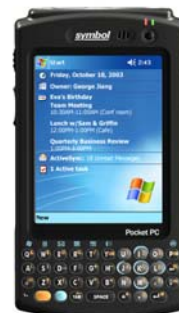
Modèle "avec Clavier"